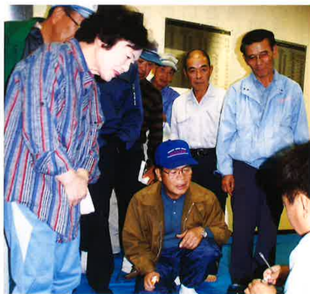
刈払機取扱い講習会

最近の特徴的な仕事では今年十月六日におきた鳥取県西部地震、大変な被害が出ました。この地震のメカニズムを調査する東京のコンサルタントの地震計の設置、測量等の補助をする仕事に二社入ってきました。鳥根県の伯太町から日野町の鵜ノ池周辺等に行き延七十