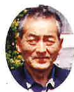
(株)米子広域シルバー人材センター