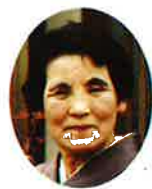
岩美町シルバー 人材センター (副理事長)