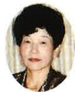
（新鳥取市）シルバー 人材センター