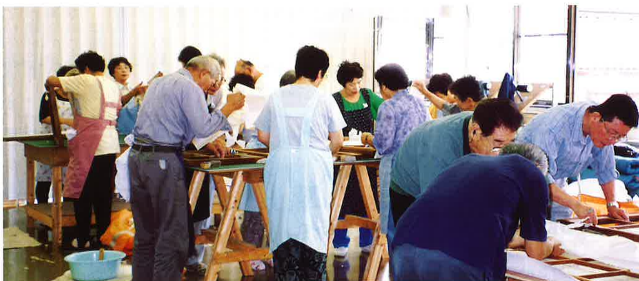
ふすま・障子張り講習会

私たちシルバー人材センターは、より良き町づくりのために会員の英知と創意、シルバークラスを結集してその実をあげ、世にその存在価値を示したいものと考えています。