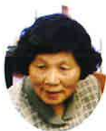
(株)倉吉市シルバー人材センター