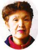
社智頭町シルバー 人材センター