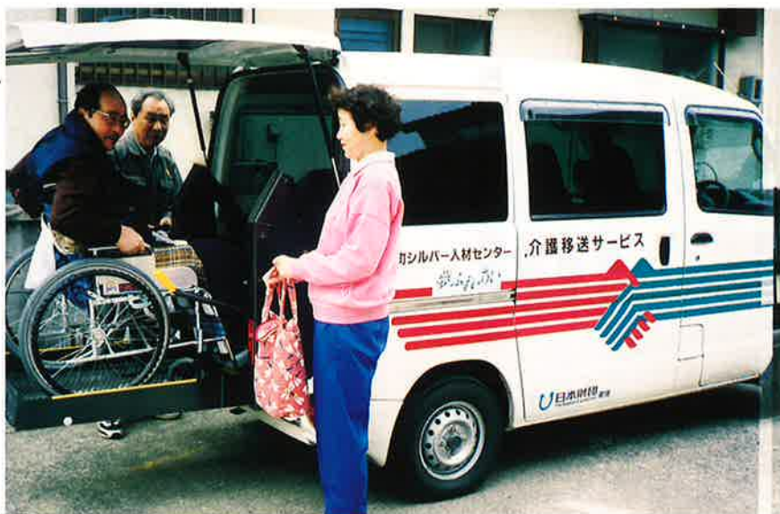
介護移送サービス

最近新聞等で報道されていますように、白ナンバーで人を移送することは陸上運送法に抵触して法律違反となり、たとえ福祉事業と