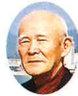
北条町シルバー 人材センター