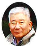
(紐鳥取市シルバー 人材センター)