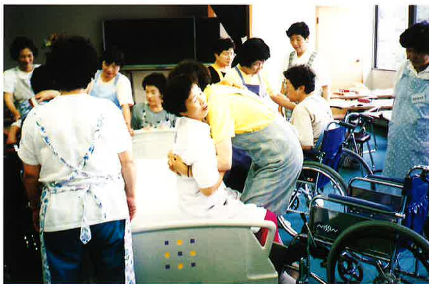
3級ヘルパー講習会

利用会員は、車椅子生活の人、七〇歳以上の独居老人・老夫婦、三級以上の障害者等、日常生活にハンディのある人。