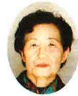
淀江町シルバー 人材センター