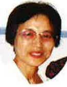
大栄町シルバー 人材センター