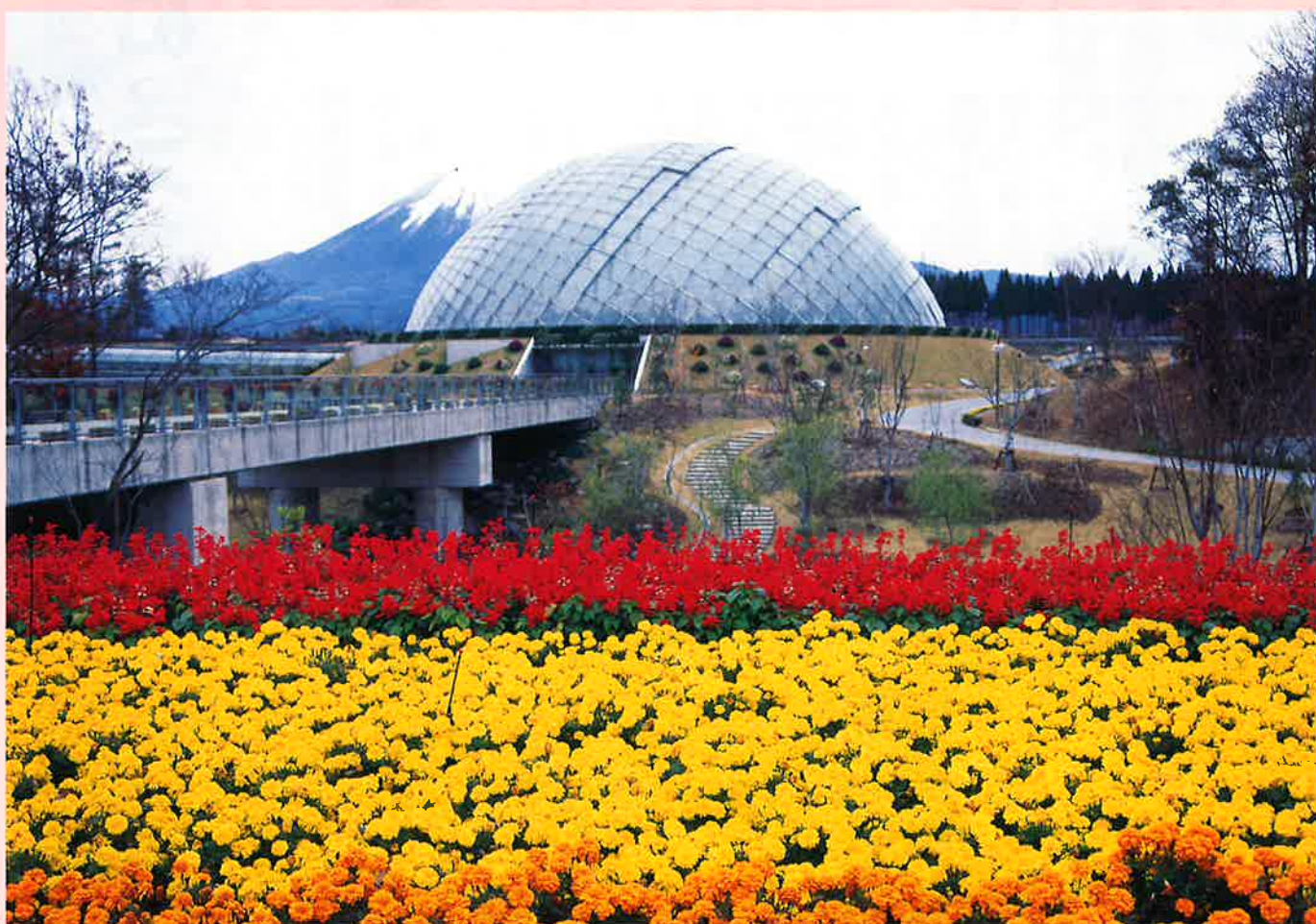
鳥取県とっとり花回廊（鳥取県西伯郡会見町鶴田）