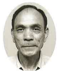
(社)倉吉市シルバー 人材センター