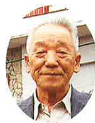
(社)境港市シルバー 人材センター