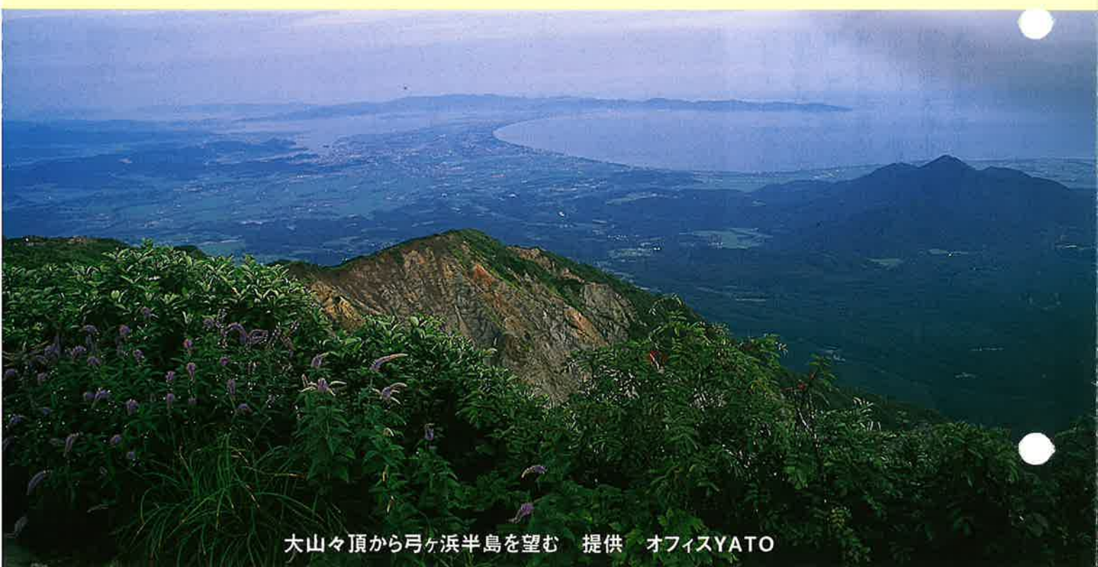
大山々頂から弓ヶ浜半島を望む