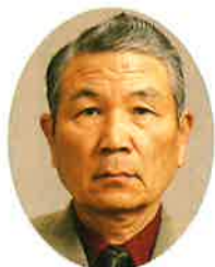
(社)南部広域シルバー人材センター 人材センター