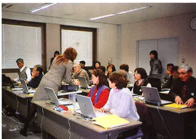
パソコン講習風景