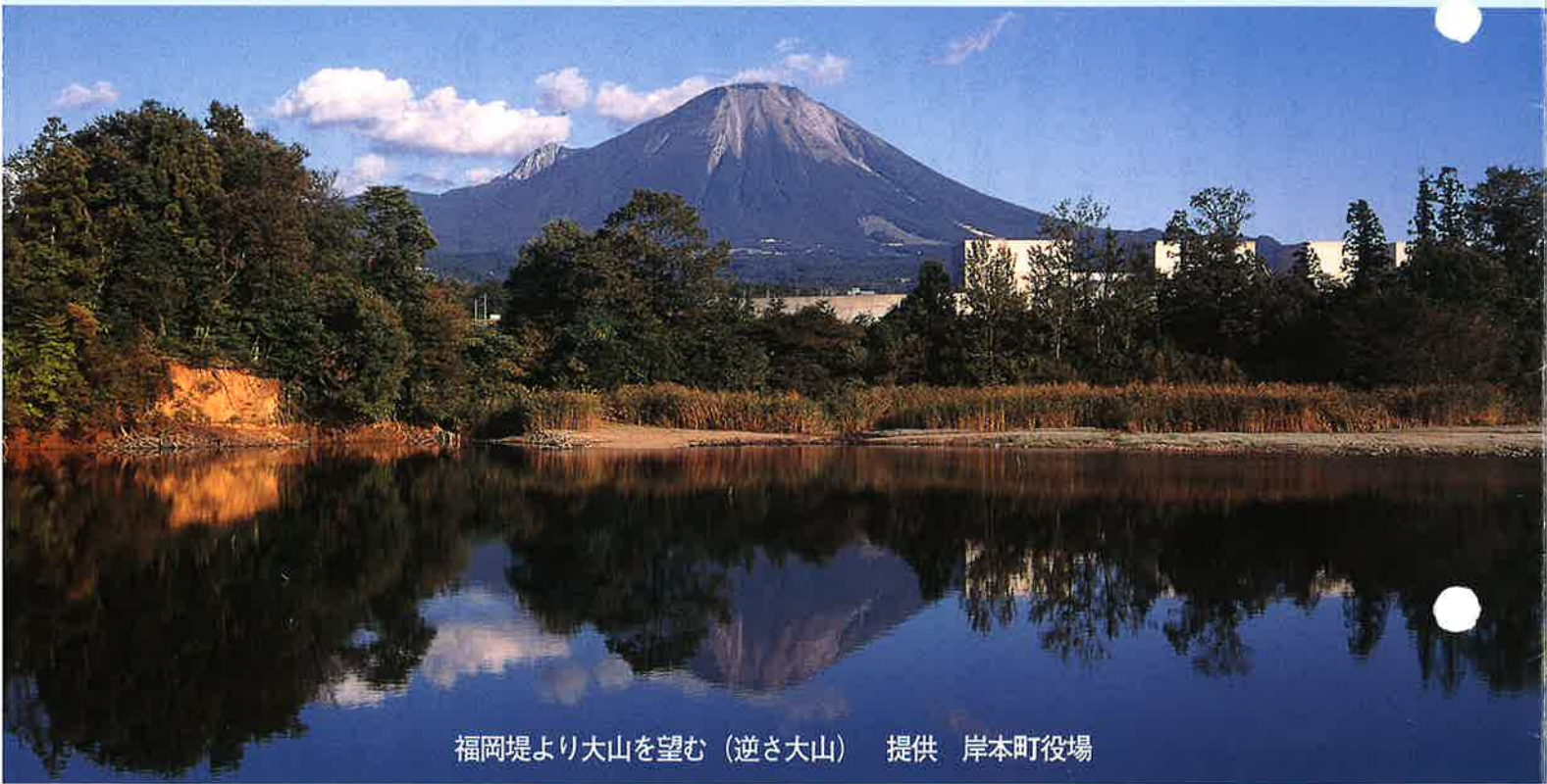
福岡堤より大山を望む（逆さ大山）