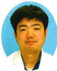
山陰労災病院 第三循環器科部長