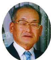
(社) 北栄町シルバー人材センター