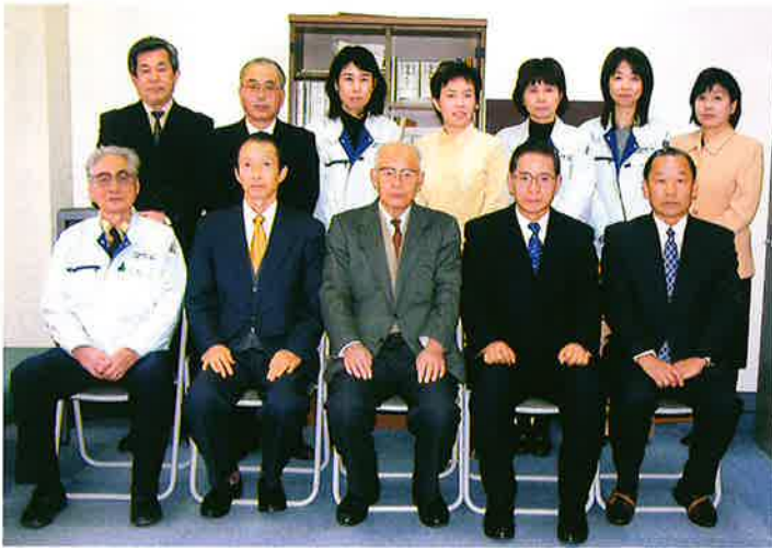
あけましておめでとうございます。 県シルバー連合会のスタッフ一同です。 今年もよろしく願い申し上げます。

今後も少人数でも、地域の為になる、人材センターの出来る事をつづけて行きたいと思ひ会員の皆様と共に健康につとめて行き人材センターの役割としたいと思っております。