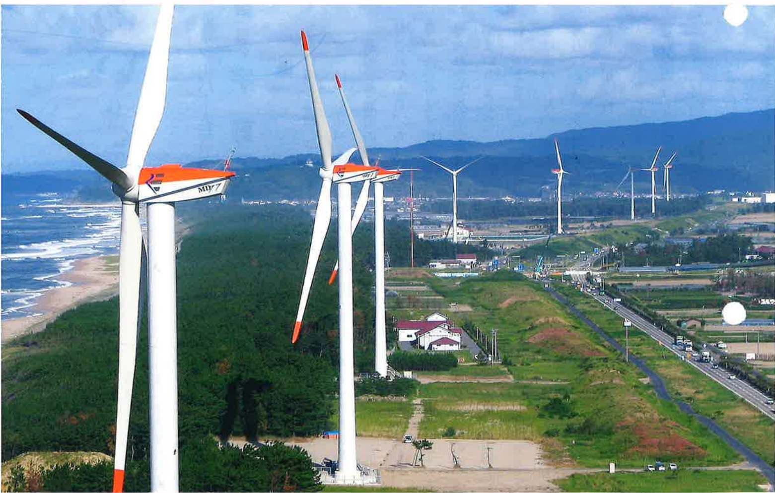
北栄町のシンボルとなった風車