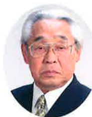
(社) 琴浦町シルバー人材センター