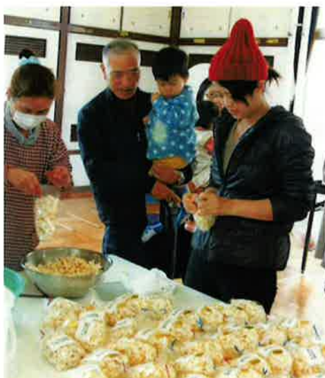
一周年を祝って子育て支援センターの親子とポップコーンづくり

県中部のシルバーでは、「シルバー婚活」の構想もあると聞かないと……。楽しみにしています。