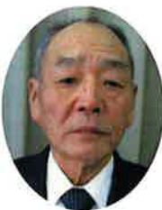
公益社団法人 琴浦町シルバー 人材センター

特に、会員拡大については、団塊の世代が六十五歳に達する中で、この年代の会員をシルバー会員として勧誘し、力強く事業展開するとともに、会員が楽しく安全に就業できる環境づくりに配慮し、北栄町シルバー人材センターが、公益法人として地域の皆様に信頼される組織として発展するよう取り組んでまいりたいと思います。