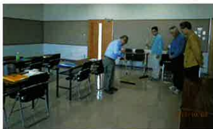
クリーンスタッフ講習②