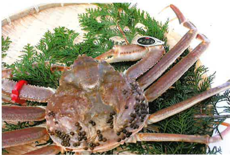
特選とっとり松葉がに 『五輝星』(いつきぼし)