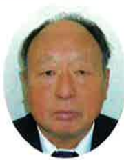
公益社団法人 湯梨浜町シルバー 人材センター

皆様の引き続きのご理解、ご協力をお願い申し上げますと、ともに関係者の皆様のご健勝とご活躍を祈念申し上げ、新年のご挨拶といたします。