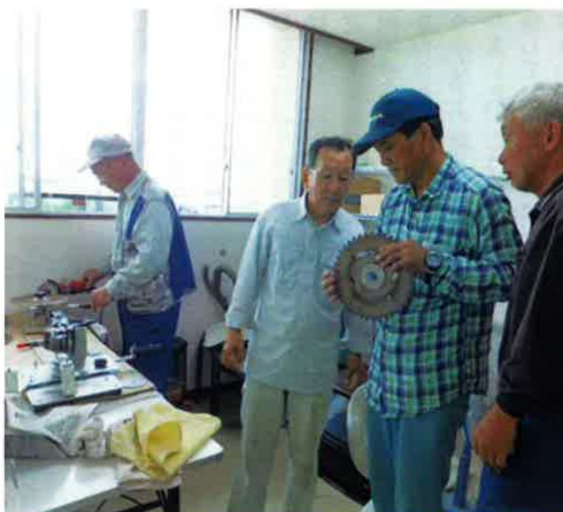
刈払機の刃の研ぎ方の講習を受ける新入会員