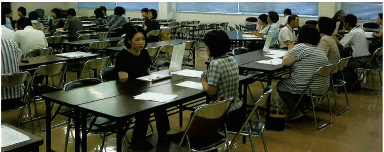
面接会（管理選考）風景