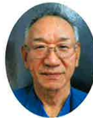
公益社団法人 北栄町シルバー 人材センター

生きがい就業のためにも、健康であることが大事だと思えます。昔から禅の教えに「心身一如」と言う言葉がありますが、「心も体も」両方共に健康で作業に集中出来ることがなによりで、どうぞこの一年が、事故のない良い一年でありたいと願っております。