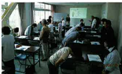
接遇・マナー講習（倉吉）