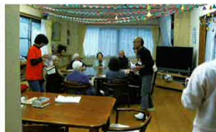
生活支援サービス講習②