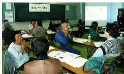
接遇・マナー講習（境港）