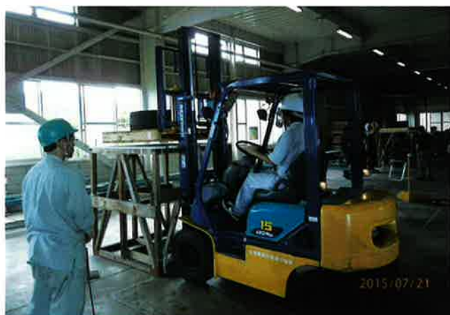
フォークリフト講習実技