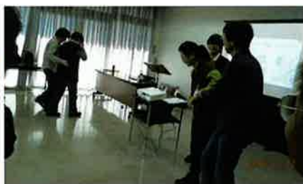
生活支援サービス講習①