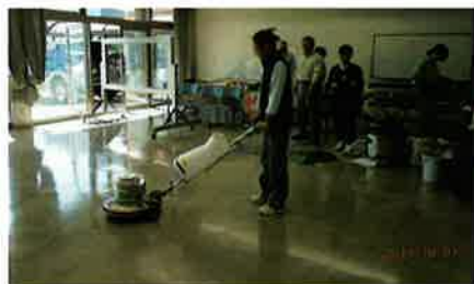
クリーンスタッフ講習①