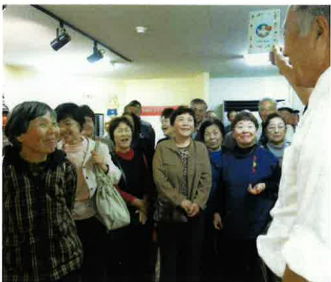
工場見学で幼いころを思い出しく説明に聞き入る会員