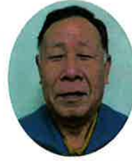
公益社団法人 智頭町シルバー人材センター