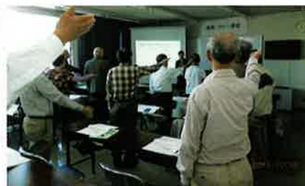
接遇・マナー講習（鳥取）